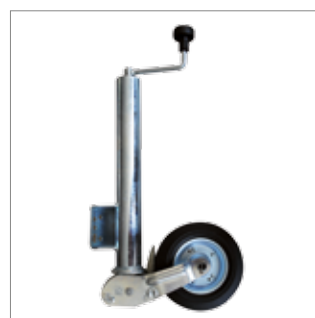
Automatik-Stützrad automatic jockey wheel