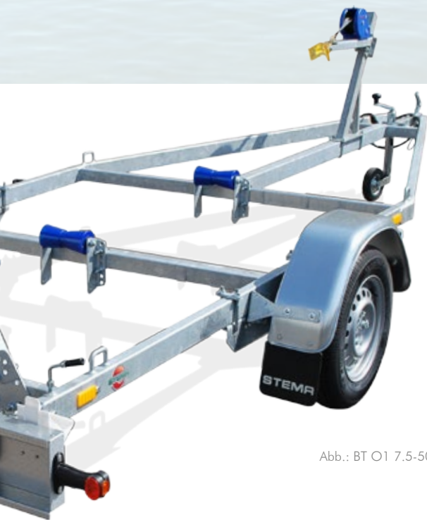
Abb.: BT O1 7.5-50-16.1