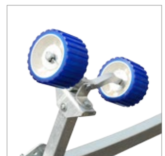
Pendelrolle mit Halter slip roller with holder